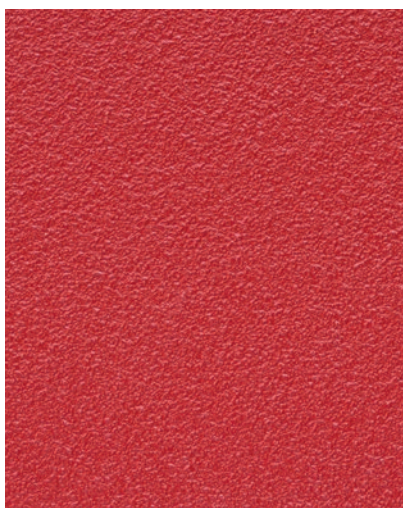
Podlahy s povrchem odolným proti skluzu